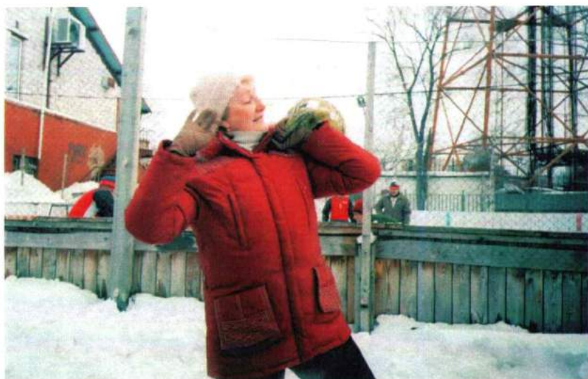
День здоровья в академии. 2007 г.