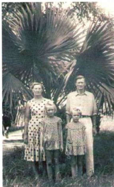
Отдых с семьей. Сухуми, 1962 г.