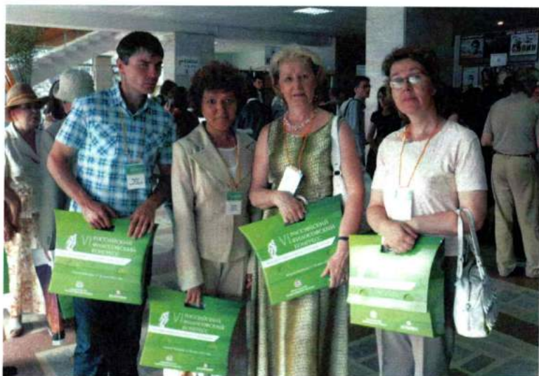
С коллегами на VI Российском философском конгрессе. Нижний Новгород, 2012 г.