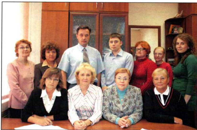
Преподаватели и аспиранты кафедры философских наук. 2011 г.