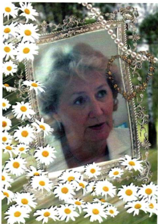
Фотоподарок от А. Н. Анисимовой. 2009 г.