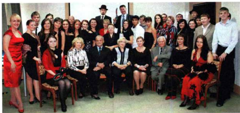
Посвящение в аспиранты Челябинской государственной академии культуры и искусств. 2010 г.