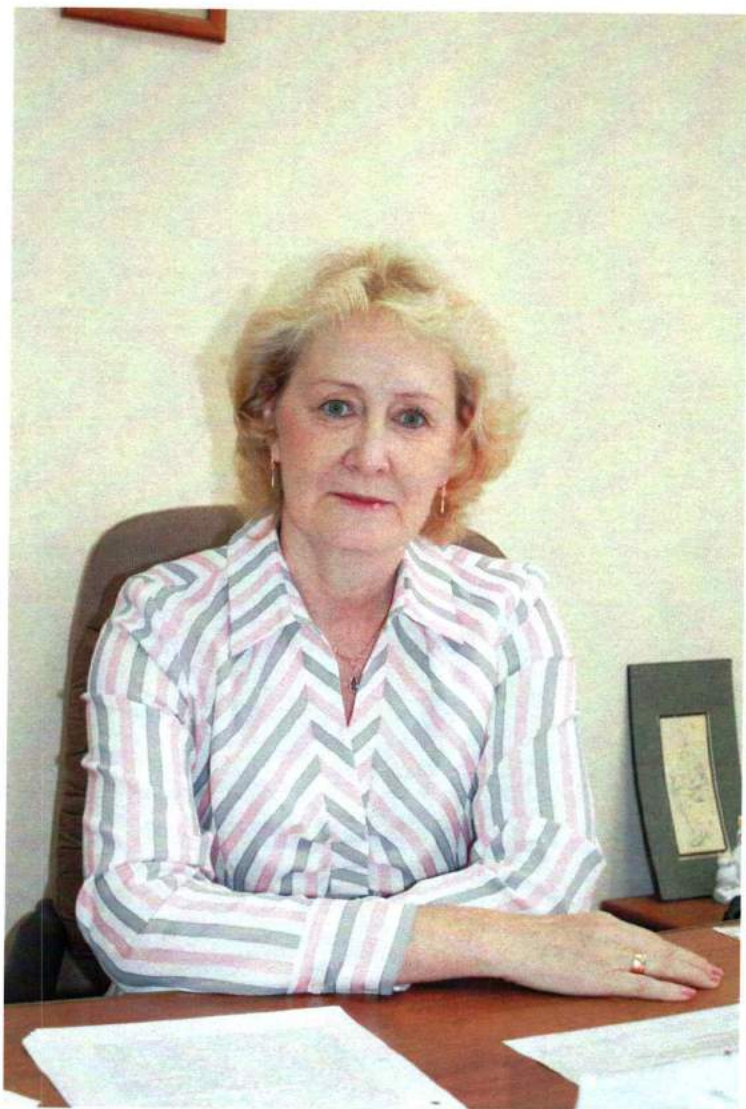
За рабочим столом. 2011 г.