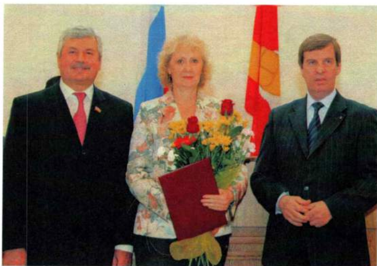
Вручение благодарственного письма Законодательного собрания Челябинской области. 2009 г.