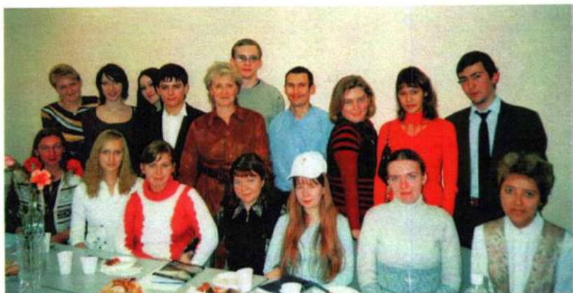
Всемирный день философии в философском клубе академии. 2005 г.