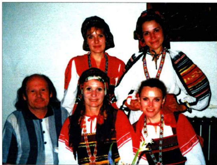
Ансамбль «Заряница» на II Международном конкурсе им. И. Брамса. Германия, 2001 г.