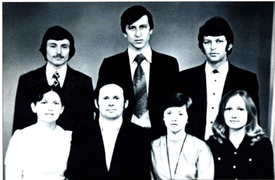
С выпускниками кафедры народных инструментов исполнительского факультета. 1986 г.