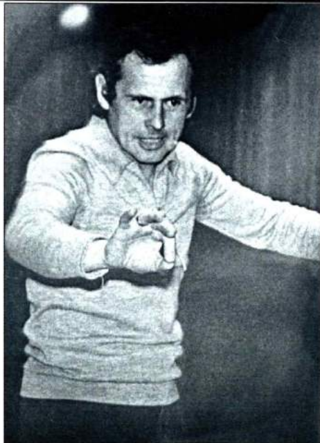
За дирижерским пультом. 1974 г.