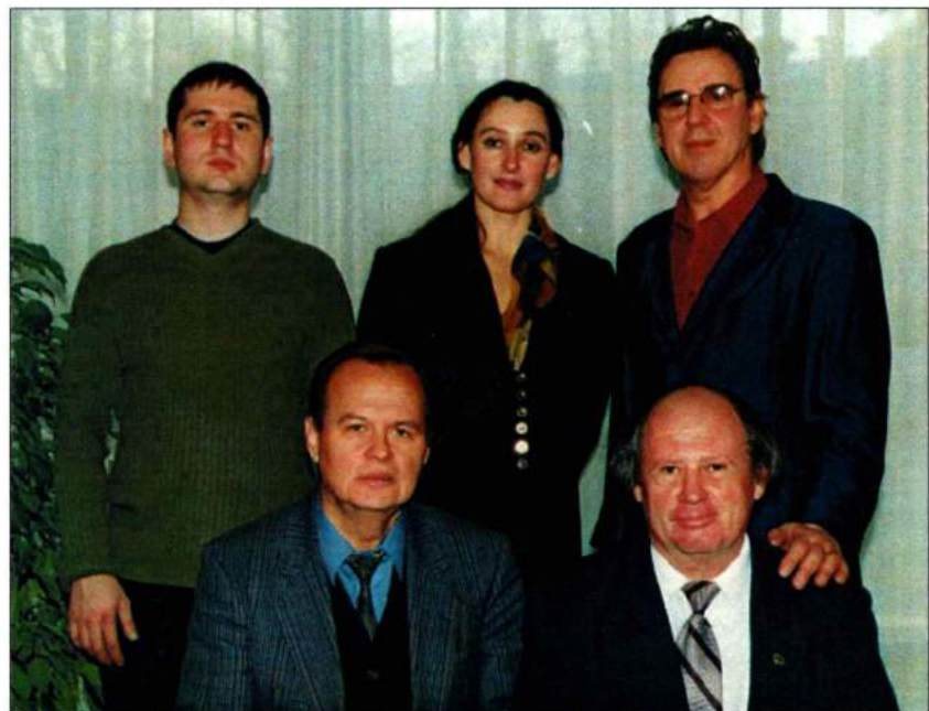
После поездки в Италию на Международный конкурс «Citta di Castelfidardo». Италия, 2002 г.