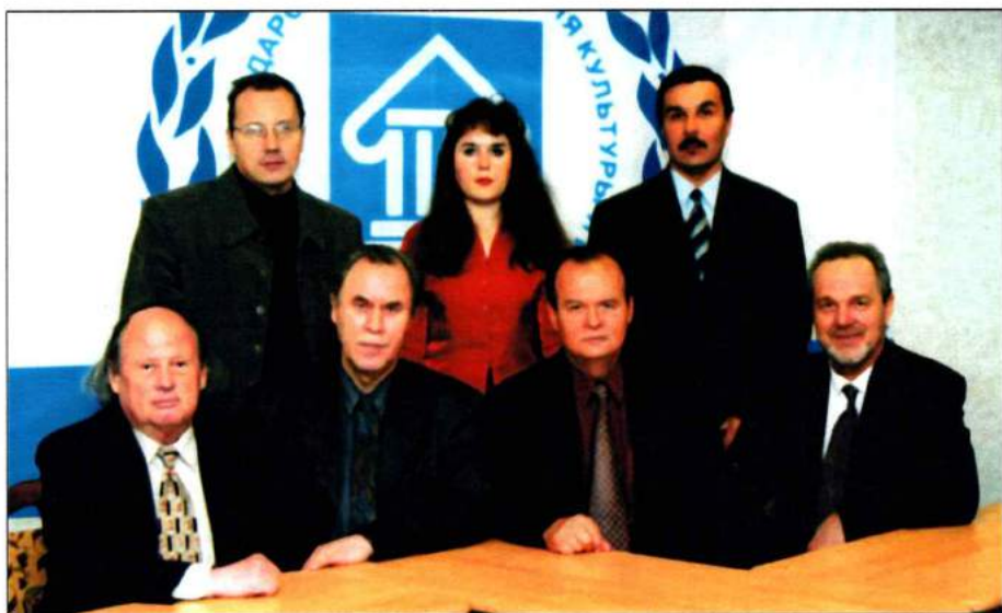
Кафедра оркестрового дирижирования ЧГАКИ. 2004 г.