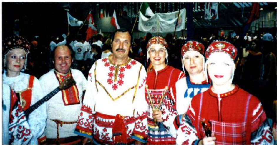
Ансамбль «Песни Урала» на I Всемирной хоровой олимпиаде Австрия, 2000 г.