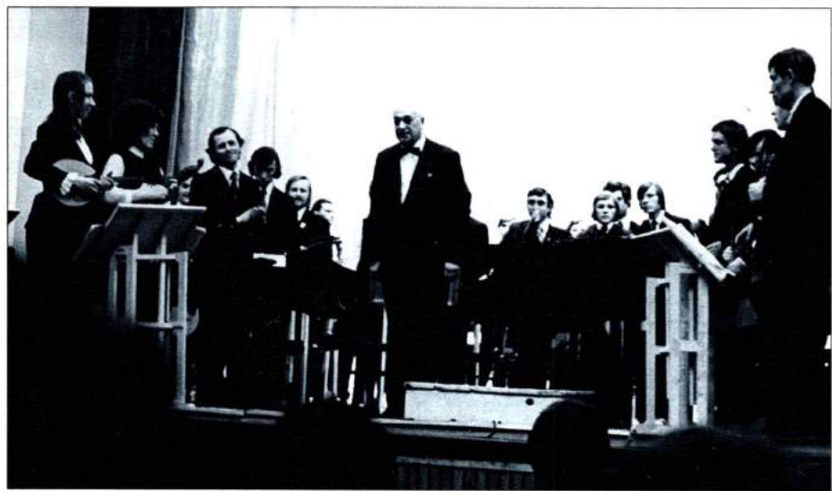
На авторском концерте Н. Чайкина. Дирижер – В. Бычков. 1975 г.